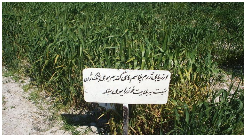
شکل 1- توده های کشت شده برای ارزیابی مقاومت به فوزاریوم سنبله گندم در ایستگاه تحقیقات کشاورزی قراخیل ساری.