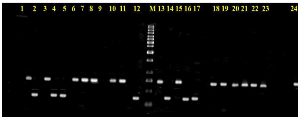
شکل 3- ژل آگارز 2% با استفاده از رنگ آمیزی اتیدیوم بروماید، حاوی باندهای ریز ماهواره حاصل از به کارگیری آغازگر GWM234 در تکثیر PCR با استفاده از DNA نمونه‌های گندم مورد ارزیابی بترتیب: 1 (Falat) 2، (KC2131) 3، (KC6158) 4، (KC6430) 5، (Sumai3) 6، (KC6390) 7، (KC6518) 8، (KC6570) 9، (KC6002) 10، (KC6104) 11، (KC6143) 12، (KC6246) 13، (KC6266) 14، (KC6267) 15، (KC6273) 16، (KC6301) 17، (KC6303) 18، (KC6343) 19، (KC6349) 20، (KC6351) 21، (KC6356) 22، (KC6362) 23، (KC6667) 24، (KC6264).

Figure 3- Agarose Gel 2% Stained in Ethidium Bromide, the produced bands of microsatellites by application of primers GWM234 in PCR using extracted DNA of wheat accessions respectively; ) 1Falat2 .( )KC2131 .( )3KC61584 .( )KC64305 .(Sumai36 .( )KC63907 .(KC6518)8 .(KC6570.( 9)KC6002.(10 )KC6104.(11)KC6143.( 12)KC6246.( 13)KC6266.( 14)KC6264.( 15 )KC6273.( 16)KC6301.( 17)KC6303.( 18)KC6343.( 19)KC6349.( 20)KC6351.( 21 )KC6366.( 22)KC6362.( 23)KC6667.( 24 )KC6264.(