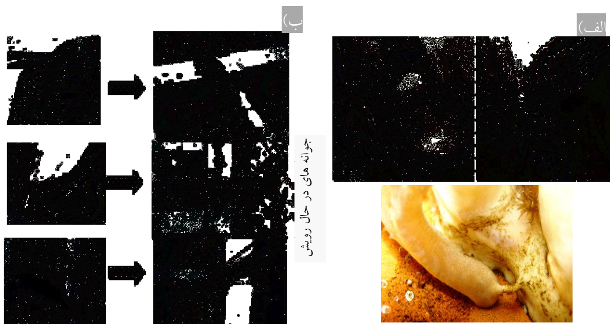
شکل 2- الف) ازدیاد اس. فلکسی بیلوس از راه شکافتگی و جدایی رشته حاصله در پایه کلنی؛ ب) ازدیاد از طریق جوانه های رویشی در جوانب پایینی قلمه ها پس از کم و بیش 2 ماه که با پیکان مشخص شده اند.