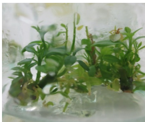
شکل ۱- پرآوری جوانه لیموی آب شیراز پس از ۴ هفته.

شیشه‌های مکارتی حاوی محیط کشت MS نیم غلظت به همراه ۶۰ و ۷۵ گرم در لیتر ساکاروز فاقد آگار و به جای آن از سیستم‌های حمایت کننده محیط کشت شامل پرلایت، ورمی کولایت و پل کاغذی و هم‌چنین پل کاغذی با MS کامل بودند. سیستم‌های حمایت کننده پرلایت و ورمی-کولایت قبل از کاربرد به مدت یک ساعت با آب مقطر شسته و کاغذ صافی به‌عنوان پل کاغذی مورد استفاده قرار گرفت. در آخرین مرحله شیشه‌ها توسط اتوکلاو در دمای ۱۲۱ درجه سانتی‌گراد و ۱/۲ اتمسفر به مدت ۲۰ دقیقه