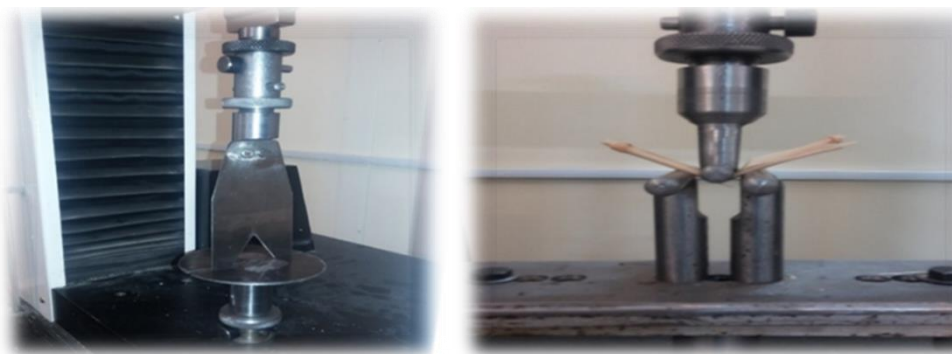
شکل ۱. کاوشگرهای مورد استفاده در این پژوهش برای آزمون خمشی (راست) و آزمون برشی (چپ)

این آزمایش در سال زراعی ۹۷-۱۳۹۶ در مزرعه دانشگاه شهید باهنر کرمان انجام شد. منطقه کشت دارای اقلیم نیمه خشک با تابستان گرم و زمستان‌های معتدل با میانگین درجه حرارت سالانه ۱۷ درجه سانتی‌گراد می‌باشد. به منظور مطالعه QTL‌های کنترل‌کننده خوابیدگی ساقه (ورس) و صفات زراعی مرتبط با آن در گندم نان حاصل از تلاقی ارقام کوکری و آرای.سی تحقیقی با ۲۲۵ لاین دابل هاپلوئید در قالب طرح بلوک‌های کامل تصادفی با دو تکرار انجام شد. کوکری در سال ۱۹۹۹ در دانشگاه آدلاید استرالیا به عنوان رقم زراعی معرفی شد. این رقم دارای کیفیت نانوائی بالا و مقاوم به زنگ زرد، اما حساس به خشکی است. آرای.سی ۸۷۵ یک لاین اصلاحی از بخش کشاورزی رزورسی است. این لاین کیفیت نانوائی بالایی دارد و حساس به زنگ زرد است، اما مقاوم به شرایط تنش خشکی است. علاوه بر این لاین‌های ایرانی مهدوی، روشن و شیراز نیز در این آزمایش مورد استفاده قرار گرفت. تراکم کاشت ۲۵۰ بوته در مترمربع بود. به منظور اندازه‌گیری صفات فنوتیپی در پایان فصل رشد از هر واحد آزمایشی به طور تصادف ۲۰ بوته انتخاب و برای اندازه‌گیری صفات به آزمایشگاه منتقل و صفات‌های ارتفاع، قطر خارجی و ضخامت جداره ساقه اندازه‌گیری شد. صفات مساحت مقطع عرضی و ممان اینرسی سطح از طریق اندازه‌گیری خواص فیزیکی ذکر شده محاسبه شدند. انرژی برشی ویژه، حداکثر نیروی برشی ویژه و سختی خمیدگی، حداکثر مقاومت خمشی ویژه و ضریب ارتجاعی که به کمک دستگاه بارگذاری کششی و فشاری چند منظوره (STM20، سنتام، ایران) به وسیله کاوشگر ۶ برشی وارنر براتزلر و کاوشگر آزمون خمش سه نقطه‌ای اندازه‌گیری شد. تصاویر دو کاوشگر برشی و خمشی را در شکل ۱ مشاهده می‌شود.