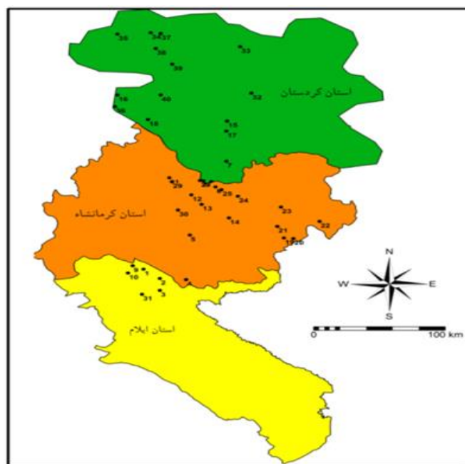
شکل ۱. موقعیت جغرافیایی نمونه‌های جمع‌آوری شده گندم اینکورن

کرمانشاه و کردستان) (شکل ۱ و جدول ۱) طی سال‌های ۱۳۹۱ و ۱۳۹۲ جمع‌آوری شدند.