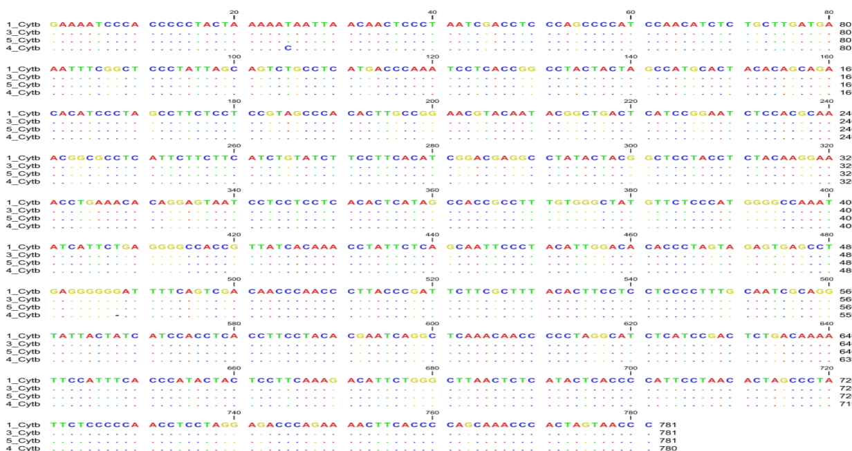
Figure 2- Comparison of the amino acid sequence of cytochrome b region in native chicken of Khorasan and domestic chicken.

شکل 3- توالی نوکلئوتیدی ناحیه سیتوکروم b، به طول 780 نوکلئوتید، برای چهار نمونه مرغ بومی خراسان.