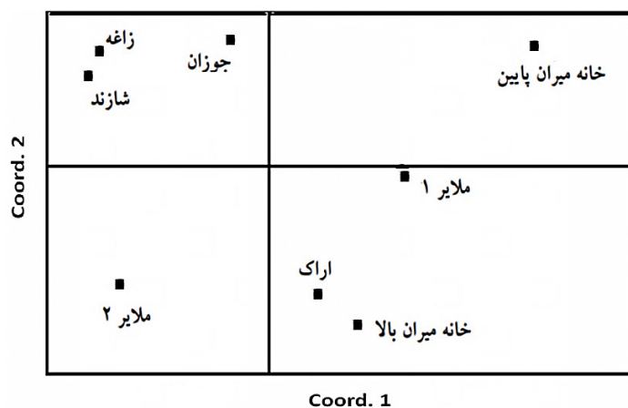
شکل ۱- گروه بندی جمعیت‌ها با استفاده از تجزیه به مولفه های اصلی.