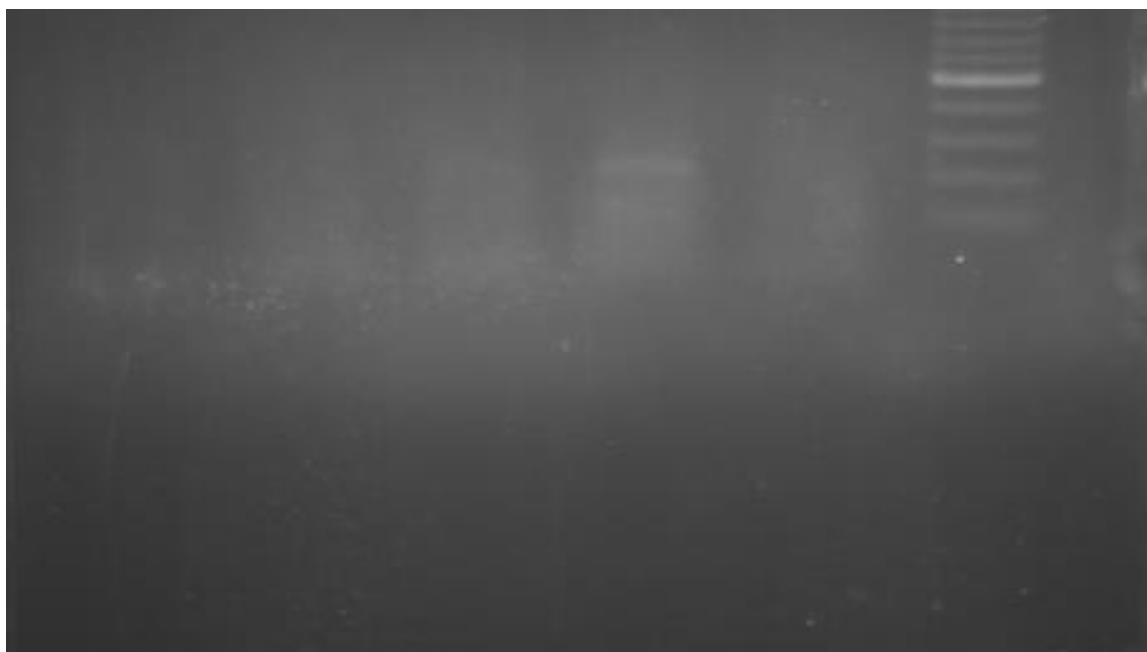
شکل ۲- بررسی محصول Real time Pcr روی ژل آگارز ۱٪.