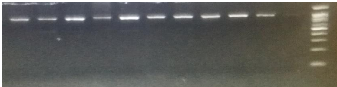
شکل ۱. قطعه ۸۹۵ جفت بازی تکثیر شده از ژنهای ATPase6 و ATPase8 در گوسفند نژاد سنجابی (نشانگر وزنی از بالا دارای قطعات ۱۰۰۰، ۹۰۰، ۸۰۰، ۷۰۰، ۶۰۰، ۵۰۰، ۴۰۰، ۳۰۰ و ۲۰۰ جفت بازی است)